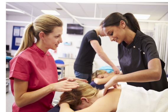
Travaillez en binôme